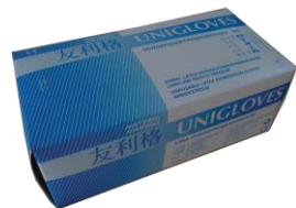
友利格经典型 有粉胶乳手套