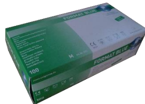
友利格加厚型 无粉定睛手套