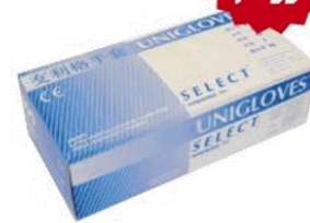
友利格选择型 有粉胶乳手套