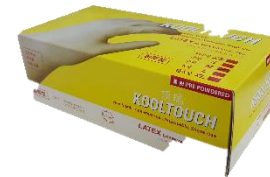
顶瑞KT-007 有粉乳胶手套