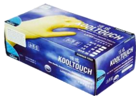
顶瑞KT 001无粉 加厚乳胶手套