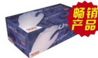
友利格舒适型 无粉乳胶手套