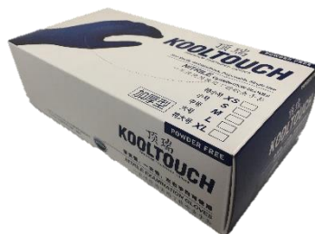
顶瑞KT-008 深蓝色丁腈手套