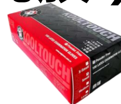
顶瑞斗牛犬 无粉乳胶手套