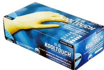
顶瑞 KT 003 无粉丁腈手套