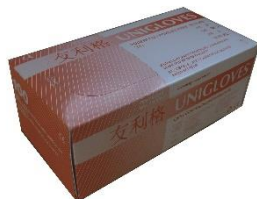
友利格经典型 无粉胶乳手套