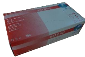
友利格选择型 无粉乳胶手套