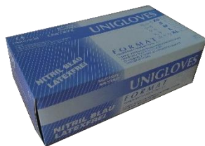
友利格紫蓝色 无粉丁腈手套