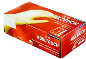
顶瑞KT 004 有粉乳胶手套