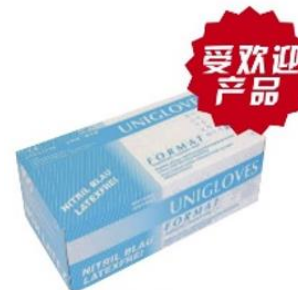
友利格选择II型 无粉丁腈手套