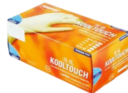
顶瑞KT 005 无粉乳胶手套